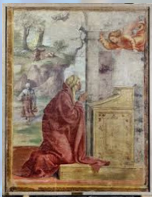
L'Angelo visita Sant'Anna e San Gioacchino

Gioacchino, dunque, chiese subito la mano della giovane Anna. I due santi sposi vivevano a Nazareth. Le loro opere erano colme di virtù, motivo per cui erano molto apprezzati e accettati dall'Altissimo. Ogni anno dividevano i loro guadagni e i profitti dei loro beni in tre parti. La prima parte veniva offerta al Signore nel tempio di Gerusalemme, la seconda veniva distribuita ai poveri e la terza serviva al sostentamento della loro famiglia.