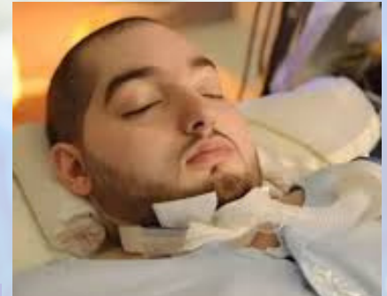
Il principe saudita Al-Waleed bin Khaled bin Talal Al Saud, noto come il "Principe dormiente", è morto all'età di 36 anni. Ha trascorso due decenni in coma.

Preghiamo affinché la situazione in Medio Oriente peggiori ulteriormente a seguito di questo evento. Maria, Nostra Signora della Riparazione, intercedi per la pace in Medio Oriente; una delle tue preoccupazioni è questa regione globale.