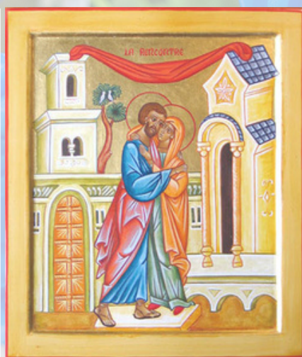
Icona dell'incontro di Sant'Anna e San Gioacchino

L'angelo non apparve a Gioacchino e non gli parlò di persona come aveva fatto con Sant'Anna, ma l'uomo di Dio lo ascoltò in sogno. L'angelo Gabriele gli disse, tra le altre cose, che il Signore desiderava il suo matrimonio con Anna.