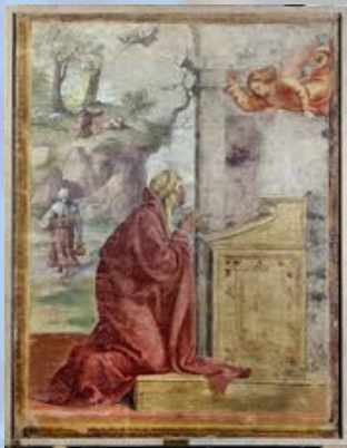
El Ángel visita a Santa Ana y San Joaquín

Así, Joaquín pidió inmediatamente la mano de la joven Ana. Los dos santos esposos vivían en Nazaret. Sus obras estaban llenas de virtud, por lo que eran muy apreciados y aceptados por el Altísimo. Cada año, dividían sus ganancias y los beneficios de sus propiedades en tres partes: la primera se ofrecía al Señor en el templo de Jerusalén, la segunda se distribuía entre los pobres y la tercera se utilizaba para el sustento familiar.