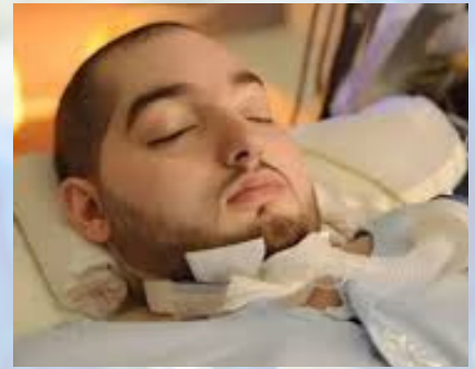
El príncipe saudí Al-Waleed bin Khaled bin Talal Al Saud, conocido como el "Príncipe Durmiente", murió a la edad de 36 años. Pasó dos décadas en coma.

Oremos, pues la situación en Oriente Medio se deteriorará aún más tras este suceso. María, Nuestra Señora de la Reparación, intercede por la paz en Oriente Medio; una de tus preocupaciones es esta región global.