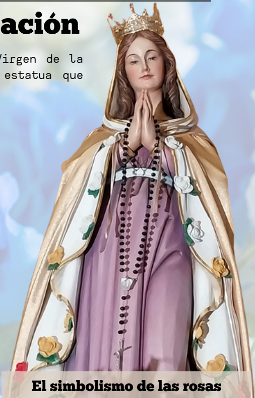
El simbolismo de las rosas