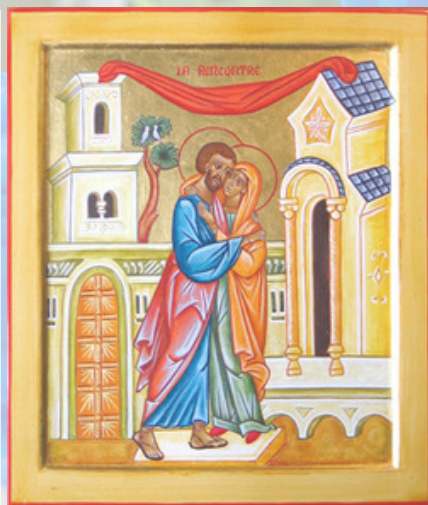
Icono del Encuentro de Santa Ana y San Joaquín

El ángel no se le apareció a Joaquín ni le habló en persona como a Santa Ana, sino que el hombre de Dios lo escuchó en sueños. El ángel Gabriel le dijo, entre otras cosas, que el Señor deseaba su matrimonio con Ana.