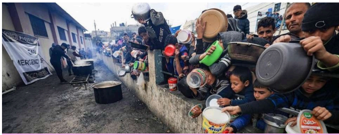
Locución del 25/06/2025